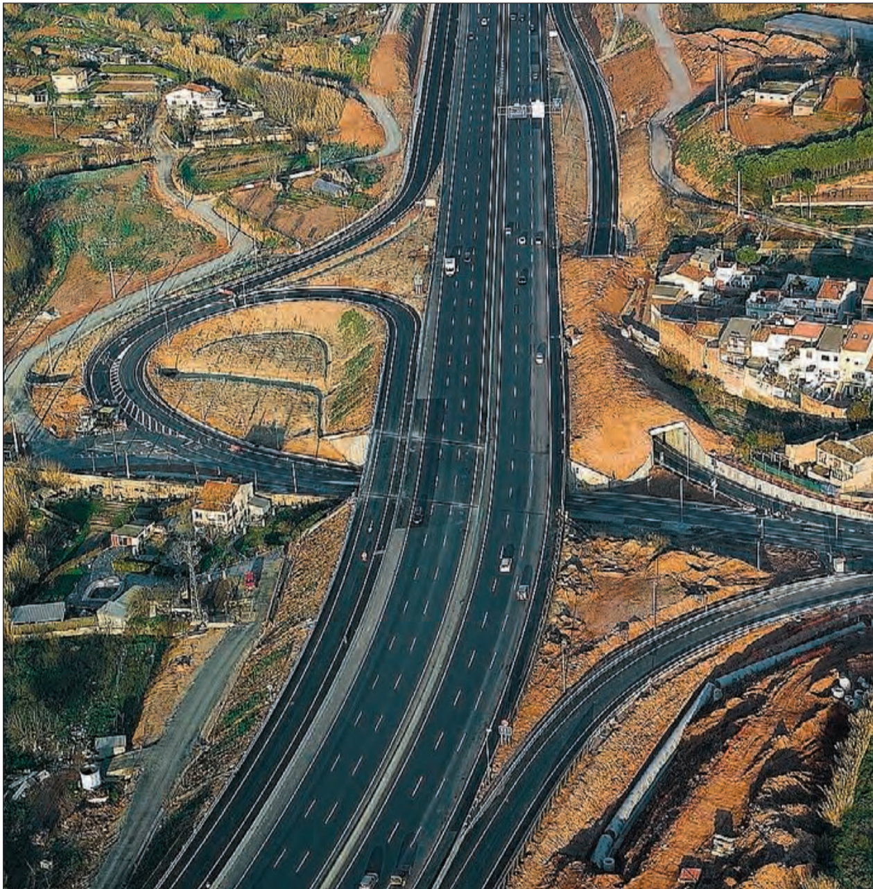
Vista aèria de l'enllaç de Joncadella (Manresa), a l'Eix Transversal.

La seguretat aporta als ciutadans i a la societat l'element fonamental que defineix la nostra convivència: la qualitat de vida. La seguretat dels treballs professionals és essencial per al normal funcionament de la societat. El servei ofert pel visat professional és responsable en gran part d'aquests avantatges, i la seva no obligatorietat, segons els col·legis professionals d'enginyers, pot fer perillar la seguretat ciutadana i anar en contra de valors que la societat i els