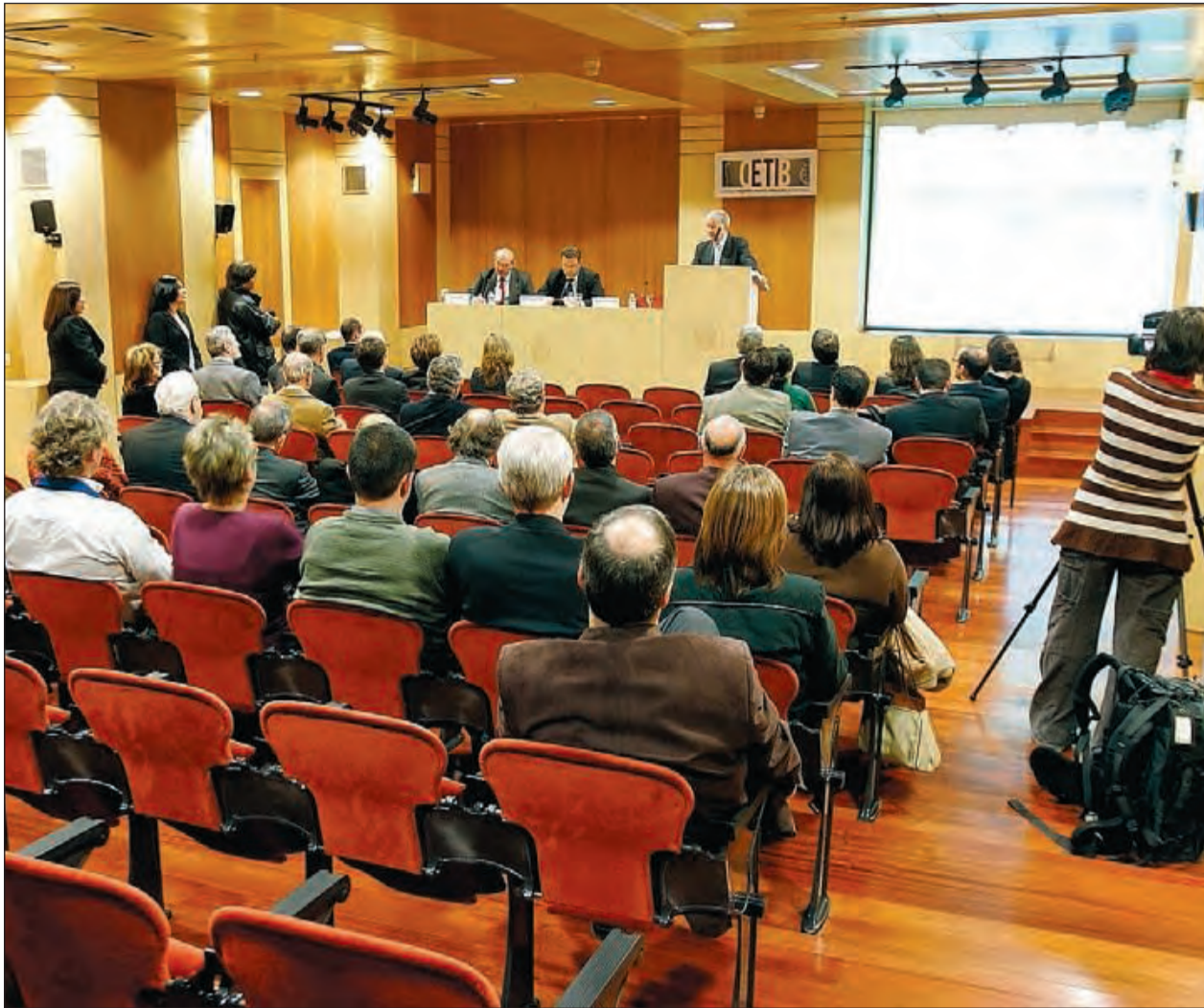
Conferència al Col·legi d'Enginyers Tècnics Industrials de Barcelona (CETIB).