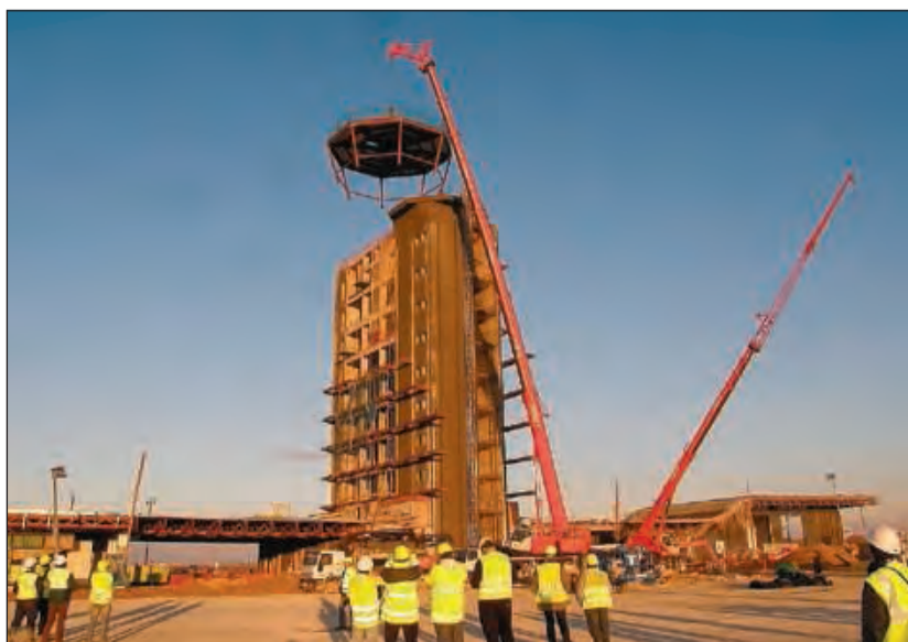
Obres de construcció de l'aeroport de Lleida-Alguaire.

El visat és, doncs, un exemple d'una càrrega administrativa per a l'activitat empresarial que, en alguns casos, podria ser excessiva. A més a més, la seva obtenció