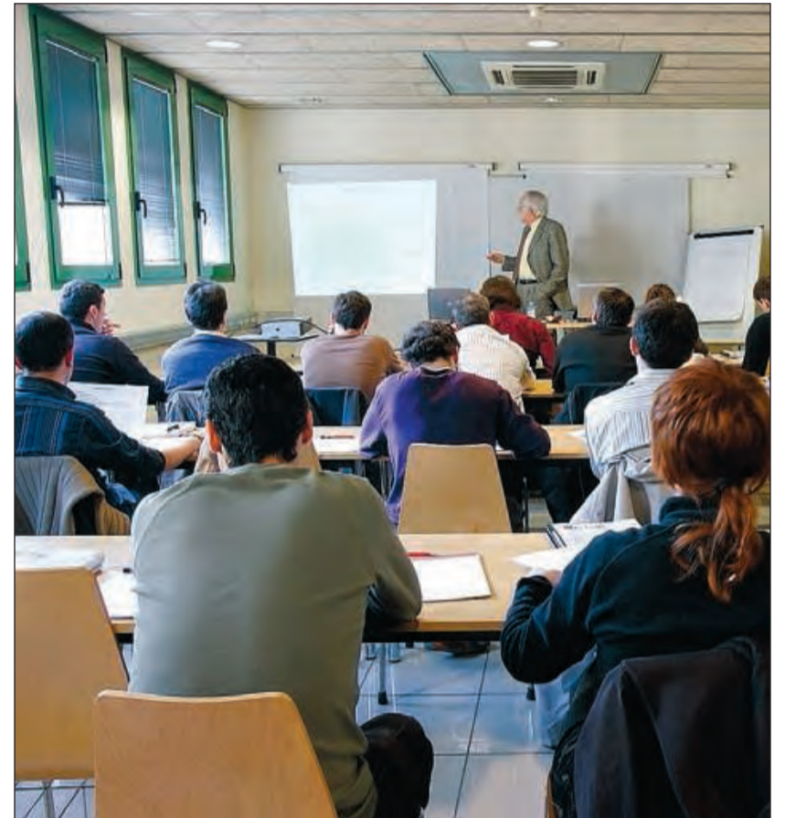
Un curs impartit en un col·legi professional.

SUBDIRECTOR GENERAL D'ENTITATS JURÍDIQUES DE LA GENERALITAT